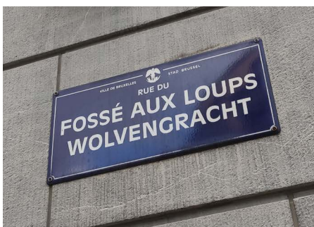
Straßenschild in Brüssel.

Selbstverständlich haben wir uns aber auch mit den Institutionen und Realitäten der Europäischen Union in Brüssel auseinandergesetzt. Hierbei konnten wir viel über konkurrierende Zuständigkeiten, Interessenskonflikte und viel-