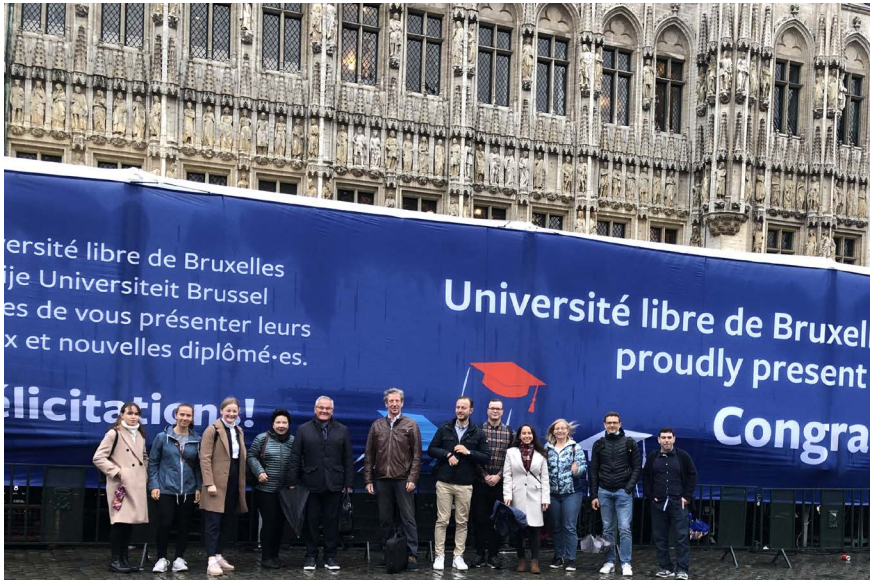
Die Gruppe vor dem Brüsseler Rathaus.

Rue Royale/Königsstraat – wer zum ersten Mal nach Brüssel reist, staunt sicher über die zweisprachigen Anzeigetafeln und Straßenschilder, die im gesamten Stadtbild anzutreffen sind. Obwohl wir uns nicht in einem „klassischen“ Grenzgebiet befinden, sind die französische und flämische Sprache überall präsent. Es bleibt nicht bei diesem ersten Staunen.