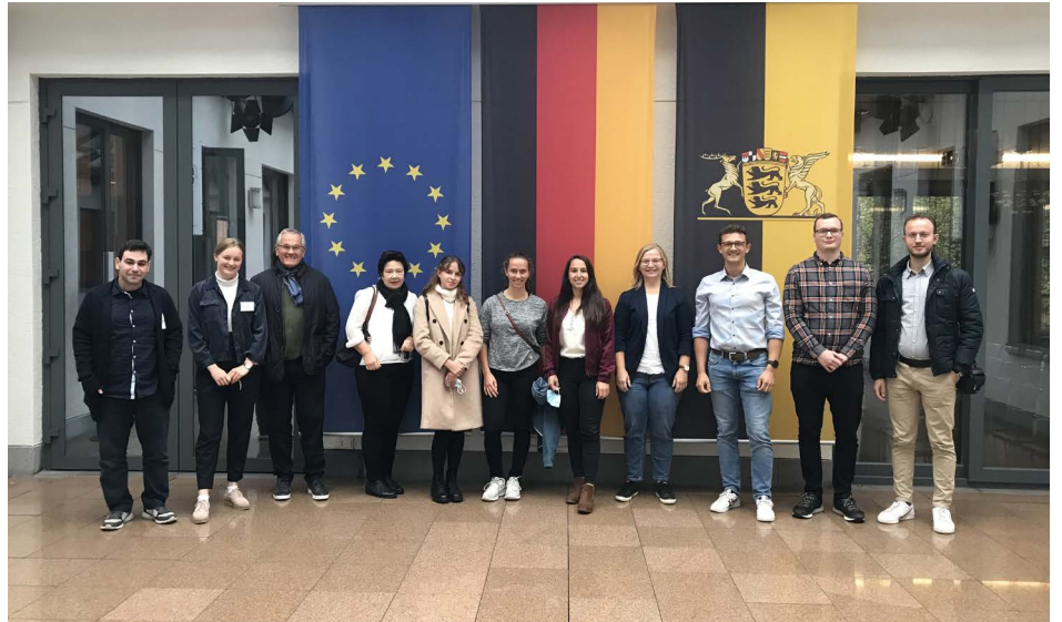
In der Landesvertretung Baden-Württembergs in Brüssel.

Mit Original-Statements von EU-Abgeordneten ausgestattet, war die Aufgabe, in einer Diskussion einen Kompromiss für einen Entschließungsantrag zu finden. Sehr realistisch wurde uns auch hier die Schwierigkeit der täglichen Arbeit vor Augen geführt. Einen solchen Kompromiss zu finden, ist harte Arbeit.